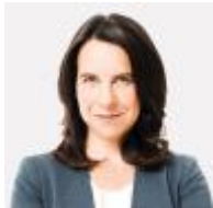
Valérie Plante Mairesse Relations internationales, centre-ville et mont Royal