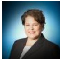
Nathalie Goulet Sécurité publique